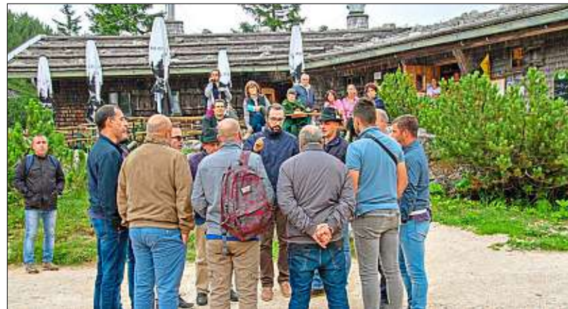
Die Besucher aus Sardinien wanderten nach einem Essen im Predigtstuhlhotel zur Almhütte in der Schlegelmulde. Sie bewunderten das herrliche Bergpanorama und ließen an mehreren Stellen ihre wunderbaren Stimmen erschallen.